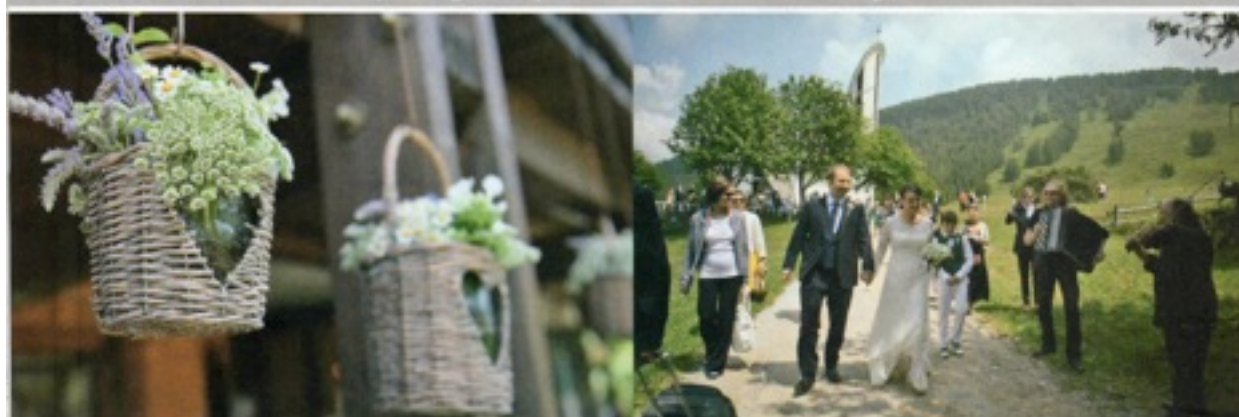
Sopra: cestini di vimini con lavanda, Ami sinage e camomilla appesi fuori dal ristorante. Dopo la cerimonia, gli sposi e gli invitati, accompagnati dai musicisti, si dirigono verso il prato dove è allestito l'aperitivo. Sotto: non mancano nemmeno le mucche.