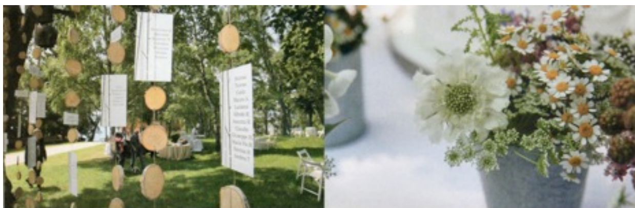
Sopra: il tableau de mariage realizzato con dischi di betulla e corda; le tavole del ristorante-rifugio Baitok, dove si è svolto il pranzo, sono decorate con vasi rivestiti di pizzo Sangallo, riempiti con mazzolini di camomilla, Ami sinage , scabiosa e lisimachia .